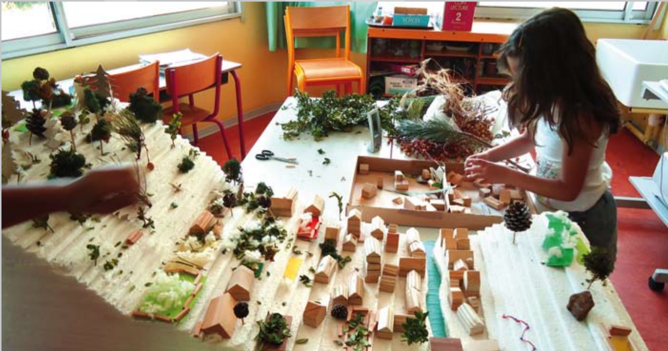
La ville de Lodève vue par des enfants de l'école Prémierlet de Lodève

Le service éducatif (SE) repose avant tout sur un travail d'équipe, associant à notre « professeur référente SE », des bénévoles comme des salariées. C'est grâce à cette collaboration créative qu'ont pu être mis en place, organisés et animés, souvent en duo, les dispositifs ci-dessous.