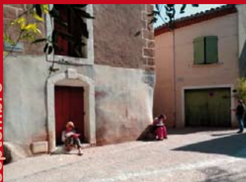
Atelier pendant les Journées du Patrimoine