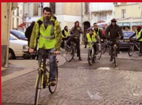
Vivre sans voiture..?