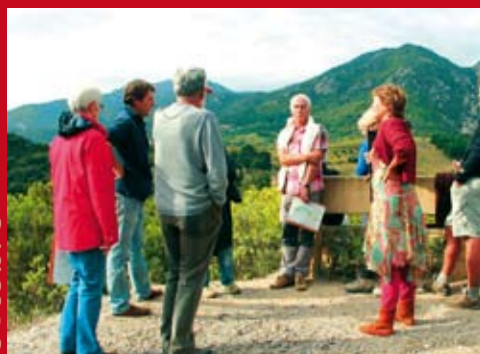
Sortie dans le cadre du mois du Patrimoine