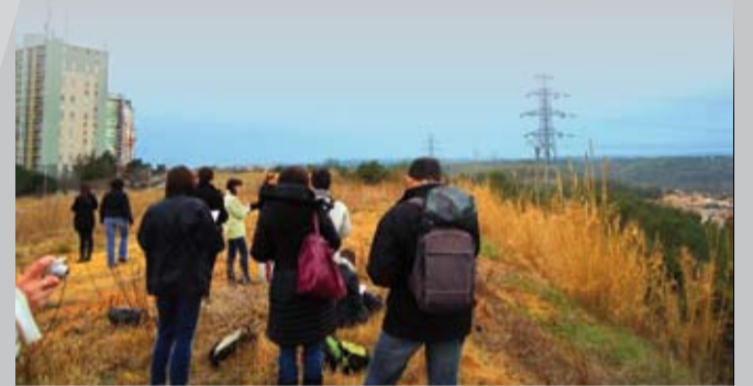
Entre la Mosson et Grabels : Formation de professeurs de collège

Une collaboration avec les enseignants et les élèves d'arts plastiques du lycée de Lodève a été mise en place pour le packaging d'une mallette permettant de réaliser des maquettes, qui verra le jour en 2013.