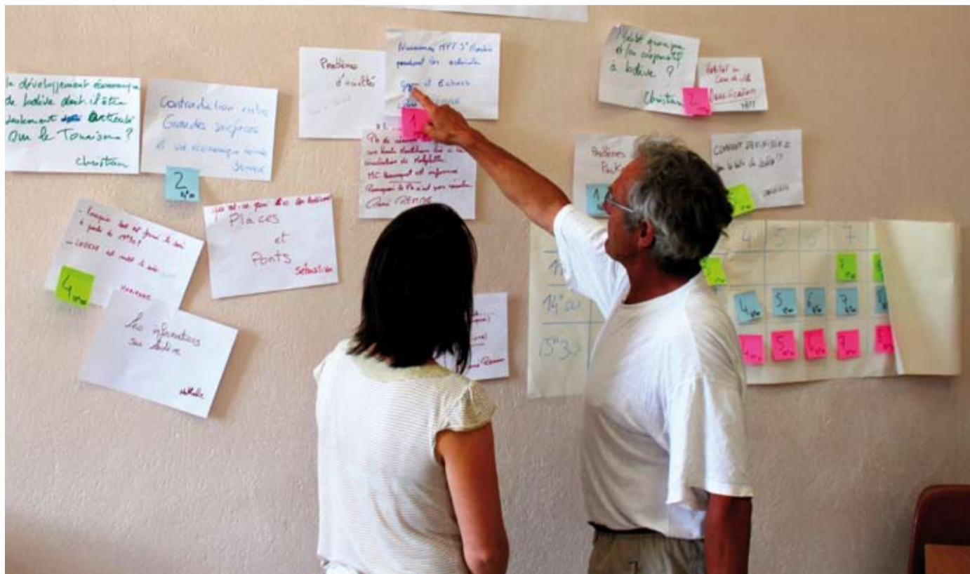
« Forum ouvert » à Lodève