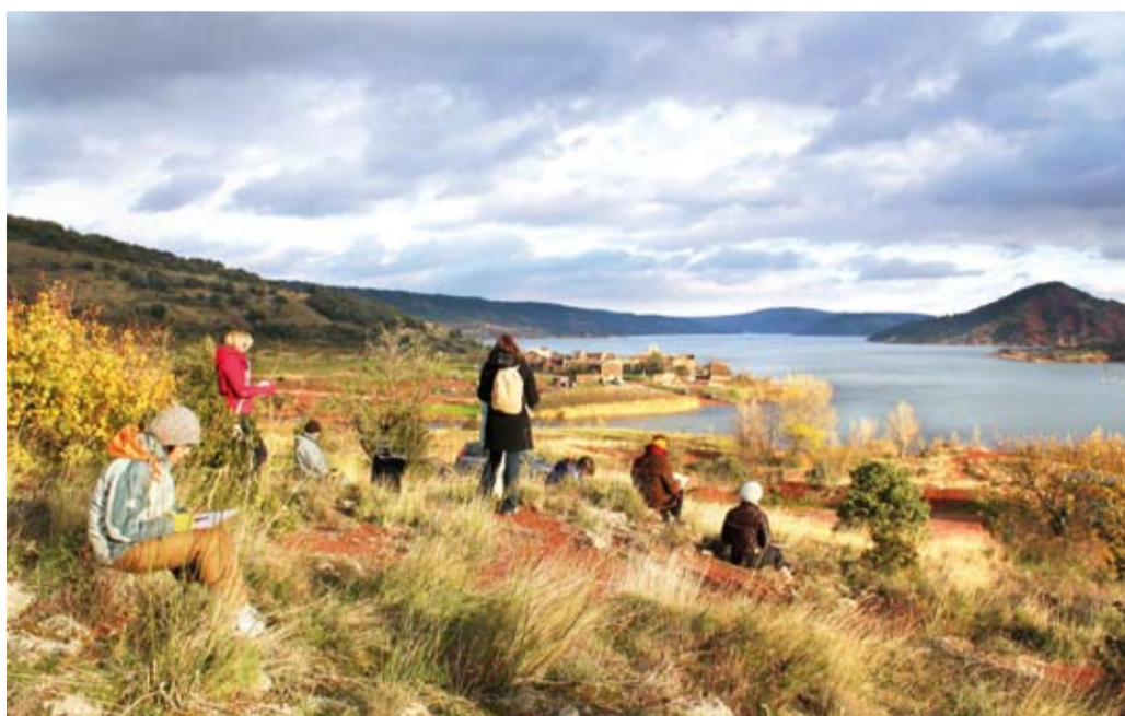
« Topographie poétique » qu bord du Lac du Salagou

Lecture de paysages poétiques, films, vidéos, balades, moments festifs, écriture, création artistique, débat ... la manufacture des paysages a décliné des rencontres multiples pour discuter et échanger sur les questions d'urbanisme avec le grand public.